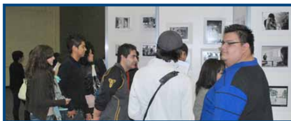
Exposición en el concurso de fotografía Premio Julio García Briseño