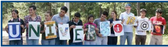
Dinámicas en los campamentos de Pastoral