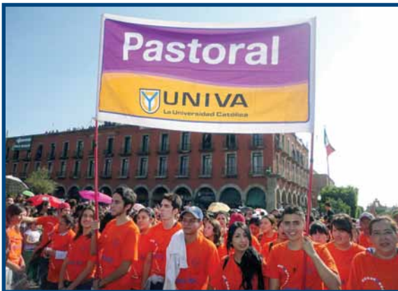
El equipo de Pastoral, presente en la Romería de la Virgen de Zapopan