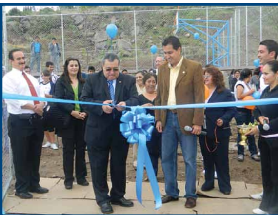
Inauguración de las multi-canchas deportivas en el Plantel León

En 2012 se realizaron inversiones y adaptaciones por una cantidad aproximada de $44'500,000, destacando entre otras las siguientes inversiones: en el Campus Guadalajara, el Centro de Desarrollo Físico Integral Juan Pablo II , con una inversión de $35'000,000 de pesos, un gran proyecto a consolidar en el 2013. Un objetivo importante durante este año fue ampliar y actualizar el Laboratorio de Animación con tecnología de vanguardia, un proyecto apoyado por fondos de CONACyT a través del programa PROSOFT y que, seguramente, sumará de manera importante al proyecto de Guadalajara, Ciudad Creativa Digital.