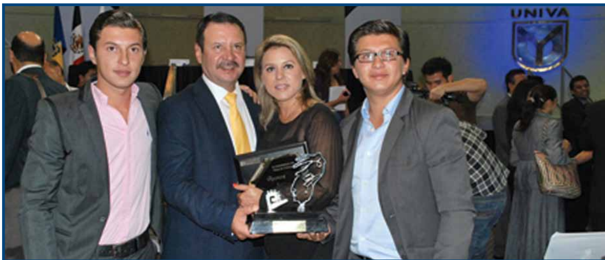
Ganador del Premio Santiago Méndez Bravo al Comunicador del Año