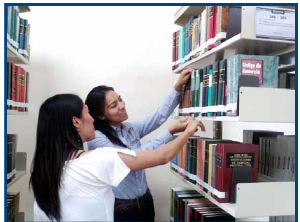
Una de las bibliotecas del Sistema UNIVA

Se aplicó la Encuesta de Satisfacción 2012 con la participación de las 13 bibliotecas del Sistema UNIVA y se obtuvieron resultados que permiten establecer la percepción de los servicios como de calidad, oportunos y suficientes.