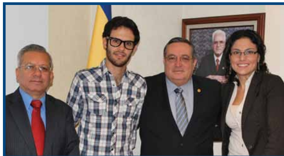
Alumno que obtuvo el segundo lugar en el Reto Nacional de Diseño, acompañado de autoridades universitarias