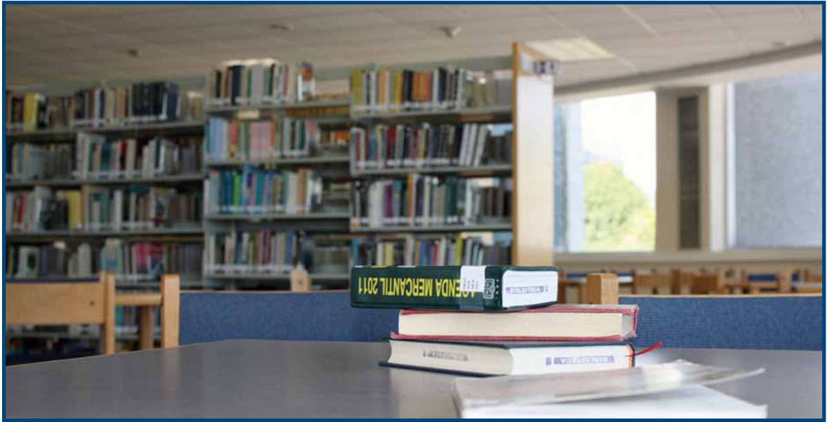
Se adquirieron 871 volúmenes más que el año pasado para incrementar el acervo de las bibliotecas del Sistema UNIVA