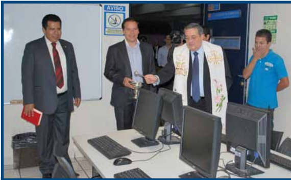
Bendición de la nueva aula de cómputo en la Preparatoria UNIVA