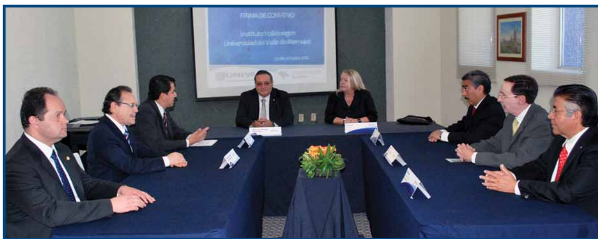
Firma del convenio con el Instituto Volkswagen

Con la finalidad de fortalecer los lazos de colaboración con diversos sectores de la sociedad, la UNIVA establece convenios para llevar a cabo proyectos y acciones de beneficio mutuo. Además de mantener vigentes y dar seguimiento a los convenios establecidos, se firmaron otros con diversas instituciones, entre los que destacan la Asociación Mexicana de Intermediarios Bursátiles (AMIB), las empresas HP e IBM, el Ayuntamiento de Tlaquepaque, las secretarías de Salud y de Turismo, la Cámara Mexicana de la Industria de la Construcción y diversas instituciones educativas y asociaciones de profesionistas.