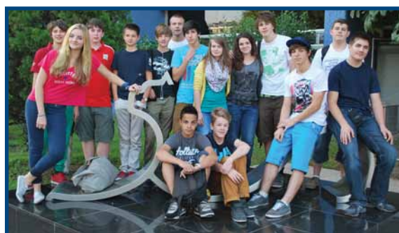
Jóvenes canadienses de intercambio en la Preparatoria UNIVA

Durante el 2012 se firmaron nuevos convenios de colaboración Internacional con 9 instituciones en Inglaterra, España, Canadá, Estados Unidos, Argentina y Brasil.