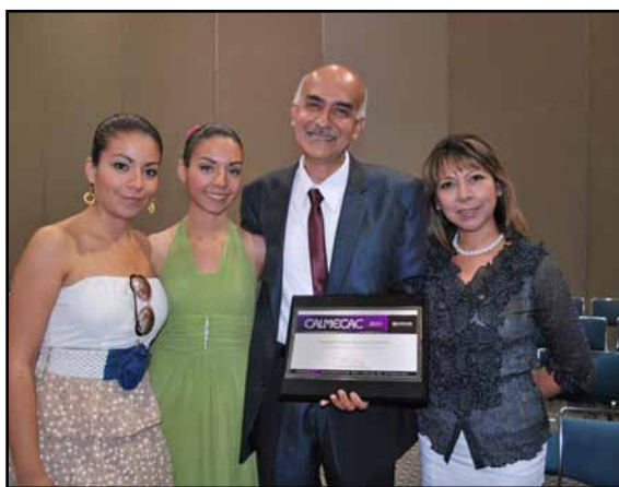
Uno de los galardonados, acompañado de su familia en la entrega del premio CALMECAC