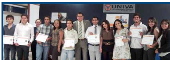
Alumnos del plantel León que fueron certificados por Microsoft