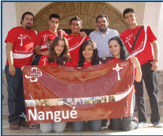
Equipo de misiones que visitó Yahualica, Jalisco