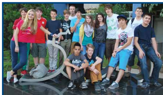
Jóvenes canadienses de intercambio en la Preparatoria UNIVA

Durante el 2012 se firmaron nuevos convenios de colaboración Internacional con 9 instituciones en Inglaterra, España, Canadá, Estados Unidos, Argentina y Brasil.