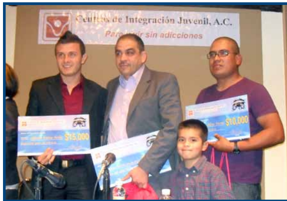
Ganadores a nivel regional en el Concurso Lean Challenge 2012

El tercer lugar como proyecto social en el concurso nacional de Estudiantes en la libre empresa Students in free Enterprise (SIFE) México 2012 fue otorgado a alumnos de Mercadotecnia del Plantel Guadalajara, reconocimiento que obtiene la UNIVA por parte de esta red universitaria global que reúne estudiantes líderes, académicos, ejecutivos de negocio y empresarios comprometidos con el desarrollo sustentable.