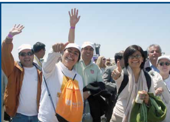
Integrantes del Sistema UNIVA en la visita del Papa Benedicto XVI a León, Gto.

significativos para la reflexión y la oración en una eficaz acción; es parte fundamental de la UNIVA.