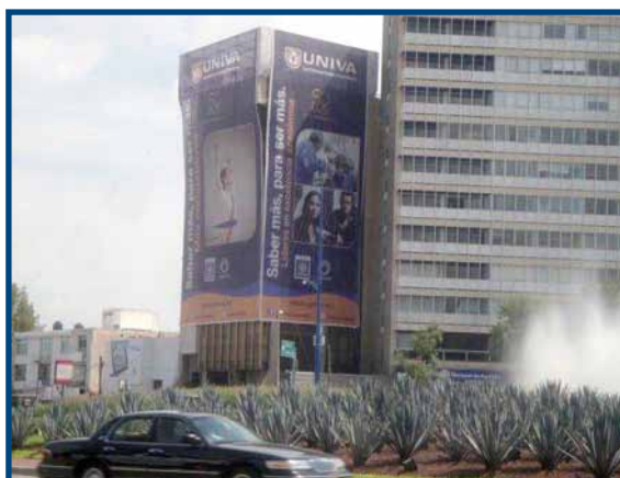
Publicidad de la UNIVA frente a la glorieta Minerva

Se revisaron los procesos de atracción, contacto e información de aspirantes, implementando estrategias de mejora en la atención y los servicios, así como la generación de canales de comunicación con padres de familia para involucrarlos en el proceso.