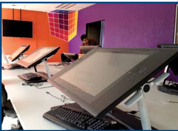
Laboratorio de Animación