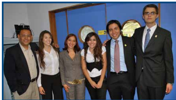
Seleccionados a nivel regional en el Concurso Lean Challenge 2012