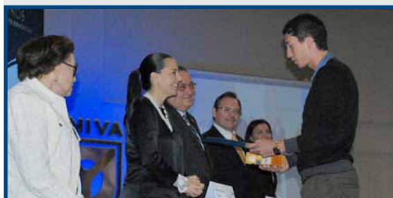
Uno de los ganadores al recibir su premio en el concurso de fotografía